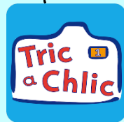
Tric a Chlic