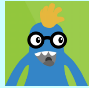
Bys a Bawd