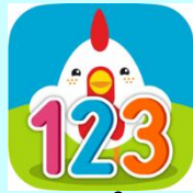
Cyfri Gyda Cyw