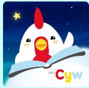
Amser Stori Cyw