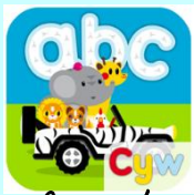
Cyw a'r Wyddor