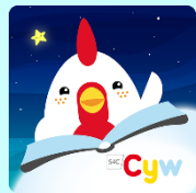
Amser Stori Cyw