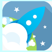
J2Launch neu J2E trwy / through Hwb