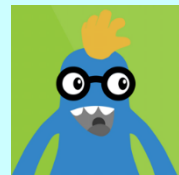
Bys a Bawd