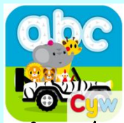
Cyw a'r Wyddor