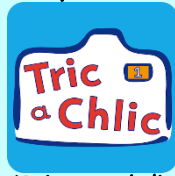
Tric a Chlic