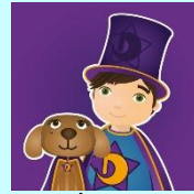
Dewin a Doti