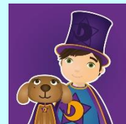
Dewin a Doti